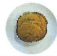
きな粉カップケーキ きな粉・卵・バター・小麦