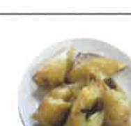
バナナと餡子の 包み揚げ あんこ・小麦・バナナ