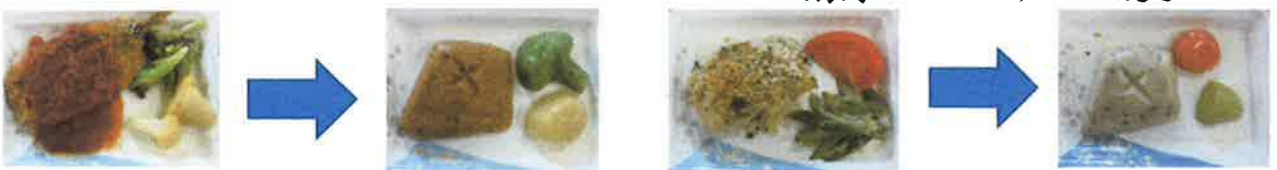
鱈フライトマトソースかけ