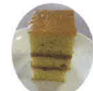
牛乳パン 小麦・牛乳・卵