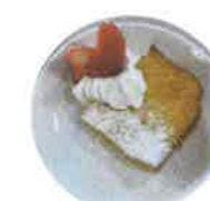
ベニエ 小麦・バター・卵・生クリーム