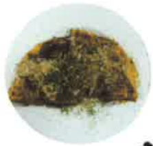
お好み焼き 大阪府