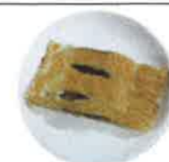
リンゴパイ リンゴ・バター・卵