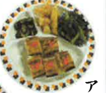
アー モンド & スパ ト ド