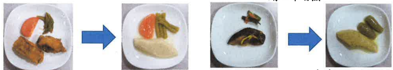
白身魚の竜田揚げ