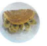
バナナオムレット 生クリーム・バナナ・卵