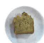
バナナケーキ 卵・小麦・バター