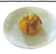
焼きパンプキン 生クリーム・卵・バター