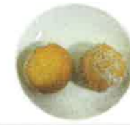
あんドーナツ 小麦・卵・バター・粒あん