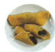
手作り八つ橋 あずき・卵

その対策の一環として 昼食とおやつでエネルギー810kal、タンパク質37g の摂取を目指している施設の手作りおやつのご紹介をします。(全てタンパク質+エネルギー)