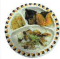
穴子の 手捏ね寿司