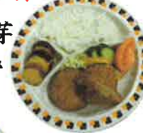
キャベツ メンチカツ