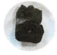
抹茶と餡子の パウンドケーキ 小麦・卵・あんこ 生クリーム