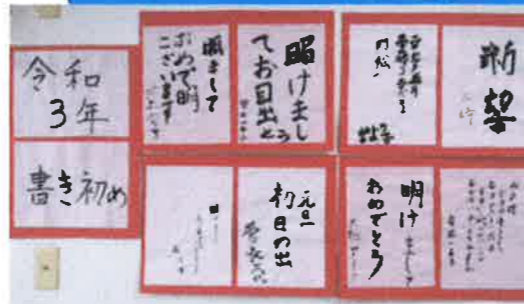
書初めをしました