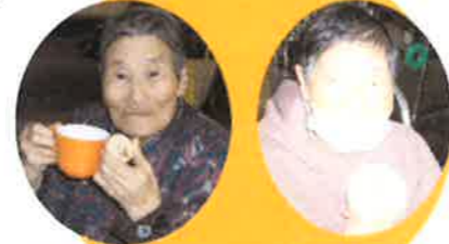
3時のおやつは祝い菓子！