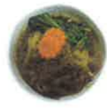
牛肉と野菜の 焼肉風