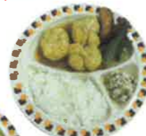
鮭豆腐の あんかけ