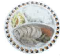
白身魚の フリッター