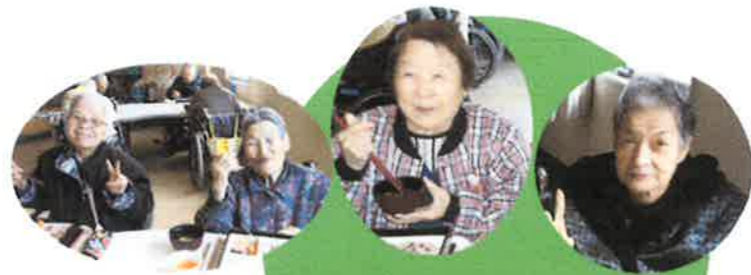
お節料理をいただきました