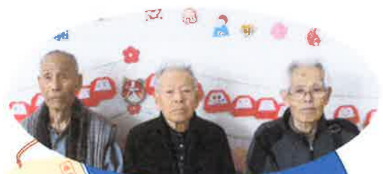
絵馬を作りました