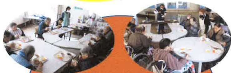
すき焼きパーティーをしました