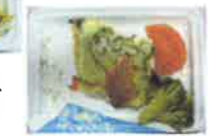
鯖のピザ風ソテー