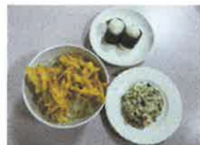
かき揚げ うどん定食