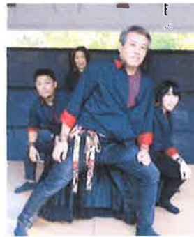
嵐：心の空 松本家 with H