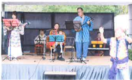
琉球民謡協会 エイミーズ