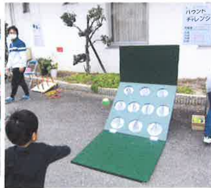
バウンドチャレンジ