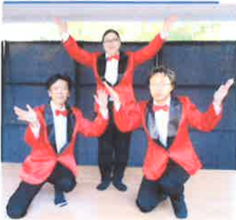
明日があるさ 3 (スリー) スターズ サラリーマンの 哀愁を描いた曲で 特養介護職員3人 で踊ります。

カラオケ大会 最後の演目です。 たくさんの方が美しい歌声を 聴かせて下さいました。