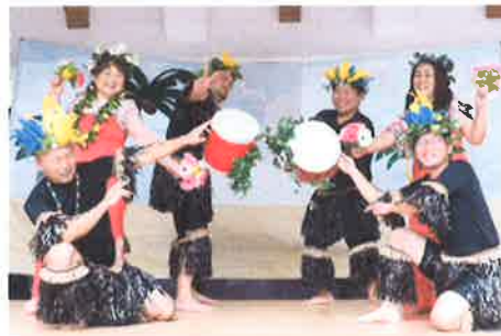
タヒチアンメロディ ビッグタヒチアンズ