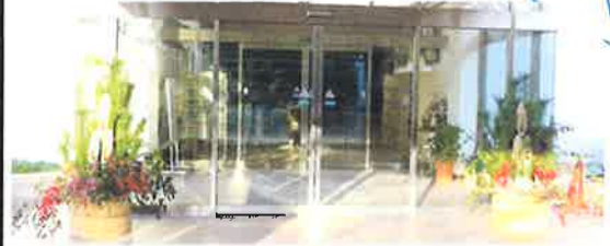
職員手作りの門松でお出迎え！