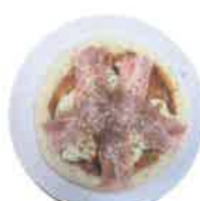
ポテサラ ベーコン