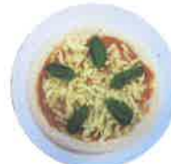
アスパラバジル トマトソース