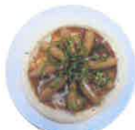
ウイナー・ ピーマン